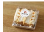
picnic ITO EGG FARM

Let's Enjoy Outdoor Life. BaseCamp OUTDOOR SHOP ...and more!