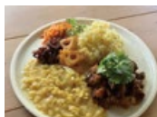
カレーのアキンポ